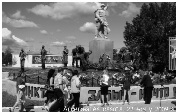
Α i ç e i a e i e a o a a o i a, 22 e p i ϋ 2009 a.