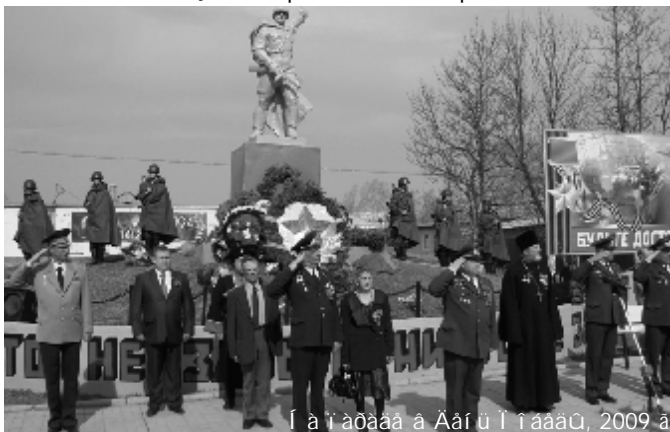
Ι ai i a d a a a Α ai u ι i ta a a u, 2009 a.

Νι a o e a e n o i i e i o i o i a o e i i i e i i e e o e a e e n aϋ ç e η i a u a n o a a i i η n o u p o. Α. Α e e n a a a a